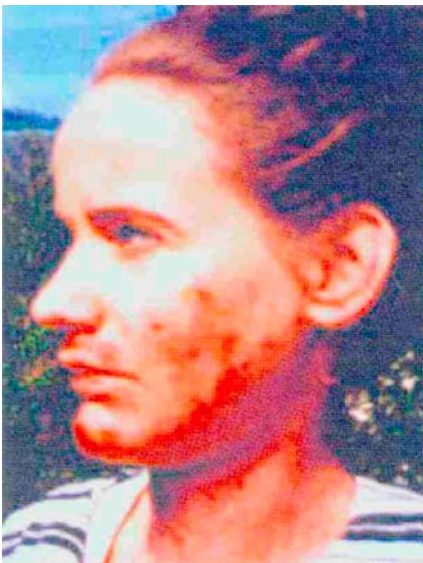
Patientin 1994, der Hautzustand hat sich wieder erheblich verschlechtert.

Die Patientin stellte sich mit einem relativ schlechten Hautzustand im Mai 1995 im Alter von 24 Jahren erstmals in meiner Praxis vor.