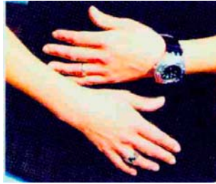
Patientin im Mai 1999, 6 Monate nach Abschluß der tiefenpsychologischen Therapie in Hypnose. Der Hautzustand ist nahezu normal und stabilisiert sich weiter

Zunächst Neuraltherapie der Stirnhöhlen, aller Narben und der Wirbelsäule. Empfehlung zur Zahnsanierung (Amalgam) und Kostumstellung (Reduktion tierischer Eiweiße). Dann Nosodentherapie (Mercurius) und modifizierte Eigenbluttherapie. Daraufhin Injektionen mit homöopathi-